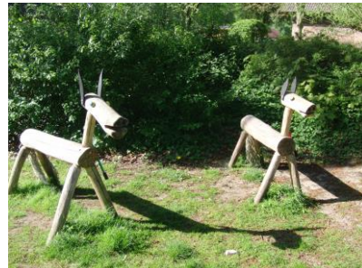
Spielgeräte für den KIGA