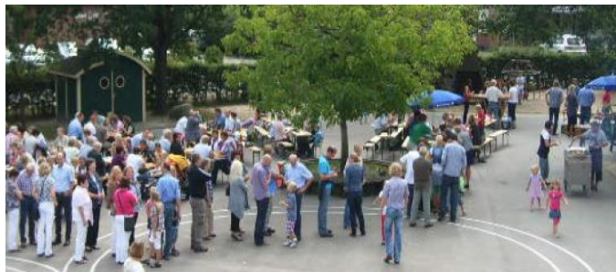
... das jährliche Einschulungsgrillen in der Grundschule